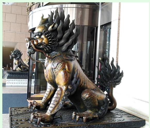
(圖 6：高雄某飯店前之獬豸)