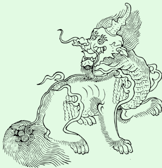
(圖1：獬豸圖)

在很多古籍當中，對於「獬豸」也都有一些記載，像是《說文解字》：「廌，解廌，獸也。似牛，一角。古者決訟，令觸不直。」、《異物志》：「北荒之中有獸，名獬豸，一角，性別曲直。見人斗，觸不直者。聞人爭，咋不正者。」、《論衡》：「獬豸者，一角之羊。性識有罪，皋陶治獄，有罪者令羊觸之。」、《神異經》：「東北荒中有獸，見人鬥則觸不直。聞人論則咋不正，名曰獬豸。」、《述異記》：「獬豸者，一角之羊也。性知人有罪。皋陶治獄，其罪疑者，令羊觸之。」。基本上，這些古籍中所描述的「獬豸」都差不多，認為獬豸擁有很高的智慧，懂人言知人性。它怒目圓睜，能辨是非曲直，能識善惡忠奸，發現姦邪的官員，就用角把他觸倒，然後吃下肚子。而獬豸喜歡居住在水邊，性情忠貞，若見二人相鬥，牠就會以角撞不對的一方；見二人爭吵則會去咬理虧者，因其與生俱有辨別是非、公正不阿的本能，所以獬豸自古被視為神獸。由於它能辨曲直，因此是勇猛、公正的象徵，更是司法強調「正大光明」、「清廉公正」的象徵。以下的「獬豸圖」乃出自《古今圖書集成·博物彙編·禽蟲典·第五十八卷》。