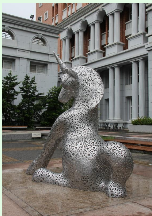
(圖 13：台北大學法學院的獨角獸「獬豸」)