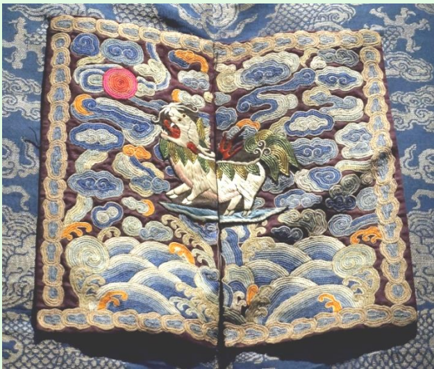
(圖 3：獬豸補服；圖片來源 Wikimedia Commons)