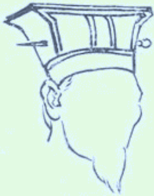
(圖 2：獬豸冠；圖片來源為 Google 圖片)

東漢，帛陶像與獬豸圖更是衙門中所不可或缺的飾品，而獬豸冠則被冠以「法冠」之名。直至清代，御史及按察使等具有監察司法身分的官員都一律戴上獬豸冠，同時穿上繡有「獬豸」圖案的補服。此外，在一些傳統建築當中，你也可以瞥見獬豸的蹤影。像是在北京故宮午門上的「仙人走獸」，除列首的「仙人騎雞」外，9個走獸分別是：龍、鳳、獅子、天馬、海馬、狻猊、狎魚、獬豸、斗牛，其中列位第八的走獸便是獬豸。