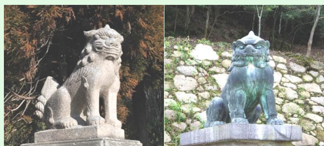
(圖 16：日本神社的「狛犬」； 圖片來源 Wikimedia Commons)