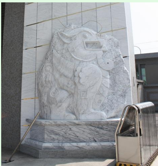
(圖 8：憲兵 202 指揮部之「忠貞獬豸」； 圖片來源：文化部公共藝術官網)