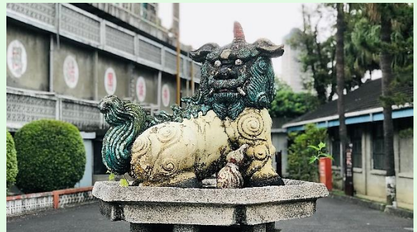
(圖 5：白色恐怖景美紀念園區之獬豸)

在臺灣，「獬豸」其實並不少見，只是一般人比較不會去注意而已。首先，下面這張照片是在國家人權博物館的「白色恐怖景美紀念園區」當中所設置的「獬豸」，外型比較像獅子，不過獅子頭上是沒有角的，而獬豸頭上是有一獨角的，而且角是往前彎而不是往後彎的。說到「國家人權博物館」，其正式成立於 2018 年 3 月 15 日，目前設有二處園區，分別是：「白色恐怖景美紀念園區」以及「白色恐怖綠島紀念園區」。「白色恐怖景美紀念園區」原為「新店二十張景美軍事看守所」。戒嚴時期這地方為軍事、政治、治安案件之審訊、羈押的場所，有許許多多政治受難者在此遭到判刑，或判處死刑，或判處刑期；1979 年發生的「美麗島事件」就是在這裡的第一法庭舉行軍法大審的。「白色恐怖景美紀念園區」在台灣人民爭取人權發展的歷史中，具有特殊意義。大家有空時，不妨可以過去看看這地方的展示，與擺設其中的「獬豸」。另外，在高雄某飯店大門外也有一座翻鑄（仿效）北京紫禁城御花園天一門的獬豸。去北京紫禁城御花園參觀時，會看到一模一樣的「獬豸」，不過北京的才是正版的獬豸，沒機會去北京看的，在高雄也看得到。