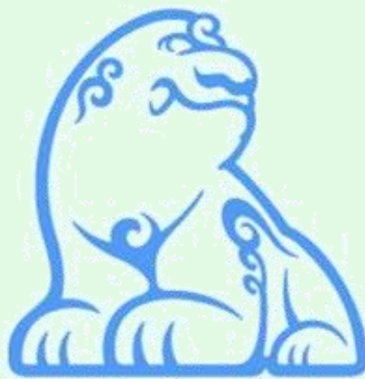
(圖 15：韓國首爾之城市吉祥物「獬豸」)

在韓國，首都「首爾」也將「獬豸」作為城市的吉祥物。2008 年，時任首爾市長吳世勳正式宣布以「獬豸」作為象徵首爾的吉祥物，以樹立更鮮明的城市形象。至於在日本，許多神社很常見到的「狛犬」(又稱：高麗犬、胡麻犬、唐獅子)，據說也是從「獬豸」的形象演化而來的。有些頭上還保留有獨角的形貌，像是以下照片的形象，不過，隨著時間的演化，現今多數的「狛犬」都已經沒有長角的樣貌了。