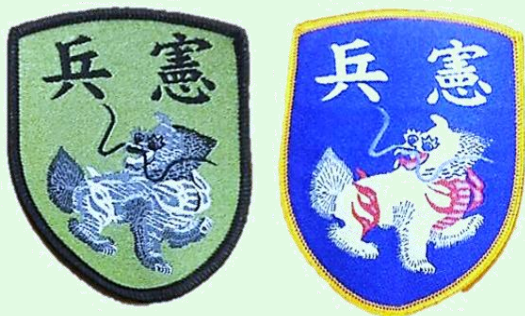
(圖 7：憲兵臂章)

另外，獬豸與臺灣的憲兵也頗有淵源，由於中華民國憲兵是執法的兵種，被稱作三軍的警察。所以「獬豸」也就成為中華民國憲兵精神的最佳象徵，憲兵軍服右臂就是縫有「獬豸」及憲兵字樣的臂章。在憲兵 202 指揮部大門旁設置有「忠貞獬豸」的藝術雕塑，憲兵 204 指揮部外也設置有「鐵衛獬豸雲水心」的藝術雕塑。