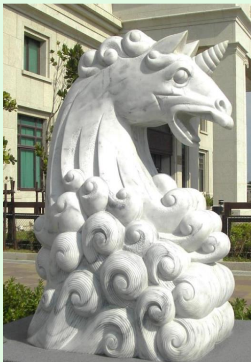
(圖 12：澎湖地檢署的獨角獸「獬豸」； 圖片來源：澎湖地檢署官網)

比較有趣的是，由於獬豸具有「獨角」的特徵，與西方神話故事的獨角獸類似，因此，就有一些場合將獬豸的形貌幻化或轉化成獨角獸，但其實原始意義應該都還是來自於獬豸。像是澎湖地檢署的吉祥物獬豸、台北大學法學院廣場平台的獬豸，還有司法官學院的院徽等，都是以獨角獸（馬）的形貌作為象徵的，與傳統上的獬豸在外觀上顯有不同。