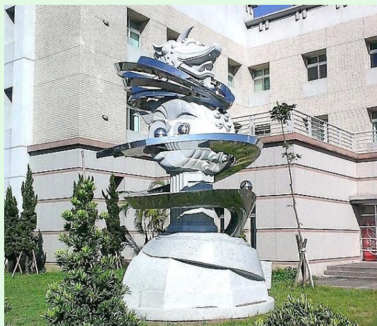
(圖 11：昔日國防部最高軍檢署的「獬豸」)

另外，過去在國防部的最高軍事檢察署的所在地也有一座造型相當特殊的「獬豸」雕像，這座獬豸的設計具有融合古今的風格，十分地特別。不過，軍事審判體系早因為軍事審判法的重大修法變革，現在已經回歸到一般的司法審判體系了。