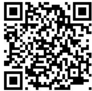
國立空中大學臺中中心 首頁