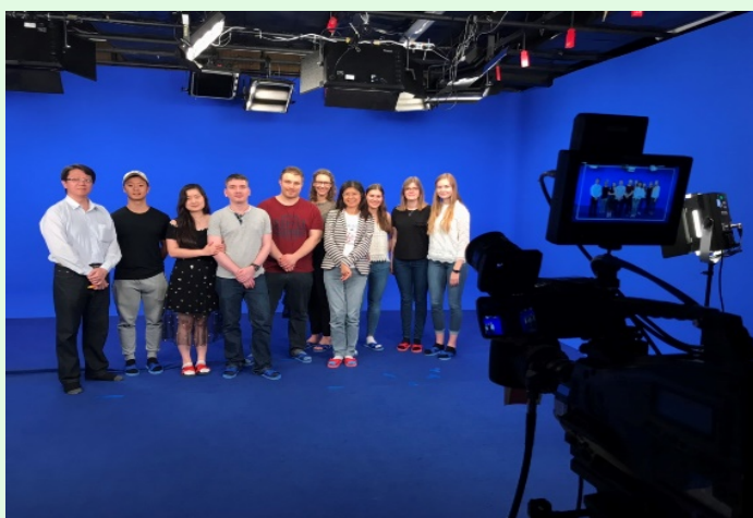
圖 7 參觀攝影棚認識媒體製作