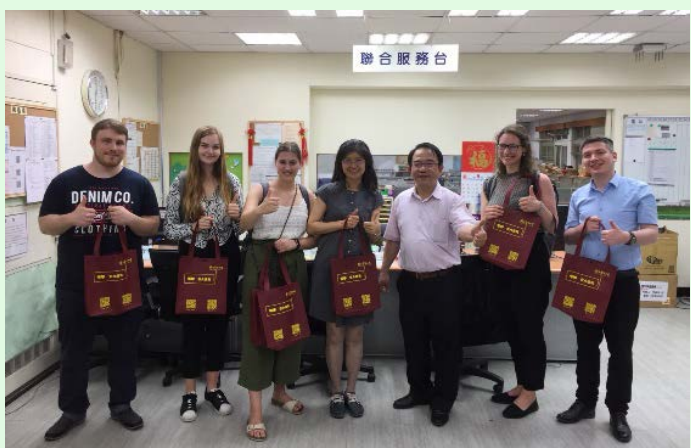
圖 8 拜訪臺北中心