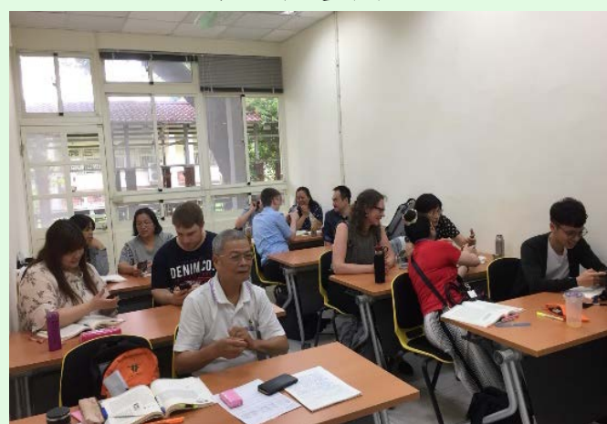
圖 11 於林谷燕老師課程與本校學生互動