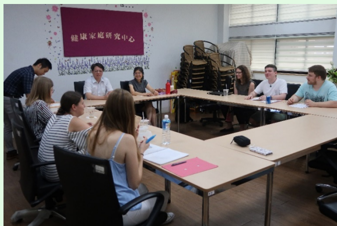
圖 32 德國學生口頭報告