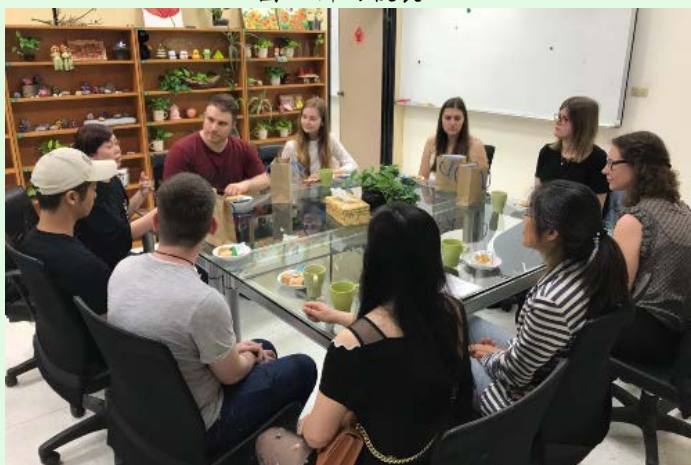
圖 6 拜訪研究發展處