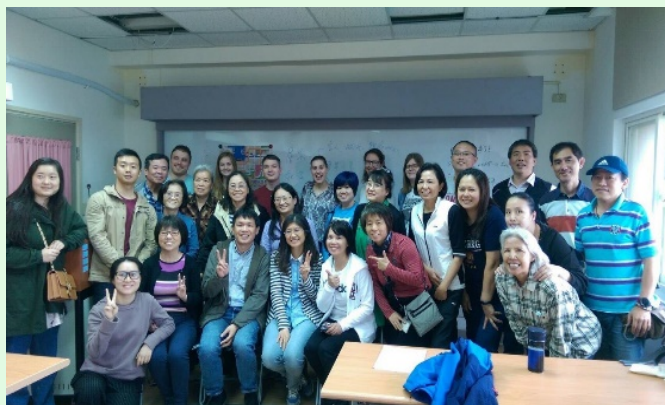
圖 9 拜訪基隆中心