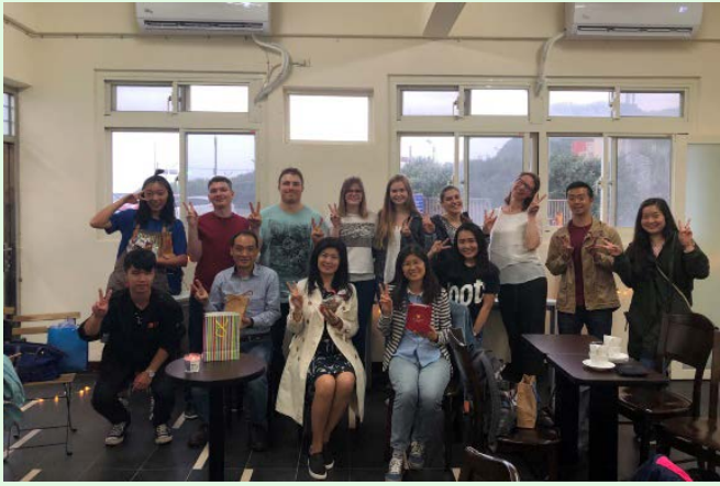
圖 18 國立海洋大學觀光學程參訪