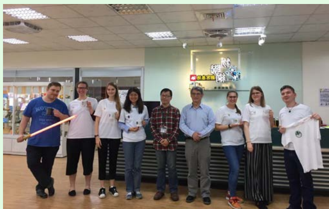
圖 21 勞動力發展署北基宜花金馬分署和創客基地參訪