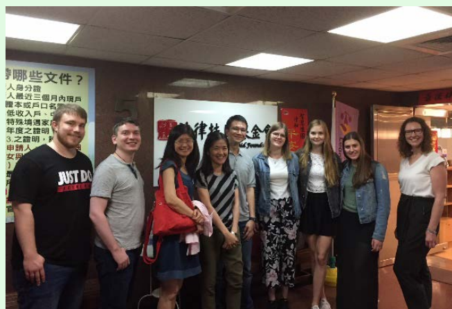
圖 30 法律扶助基金會新北分會參訪