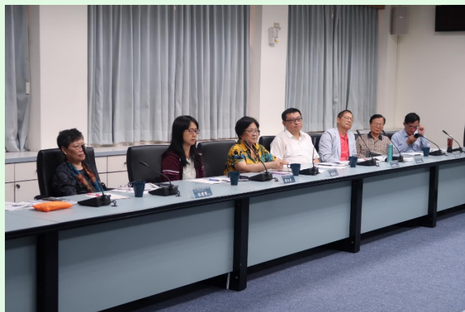
圖 4 本系兼任教師與在校學生及畢業系友之參與情形