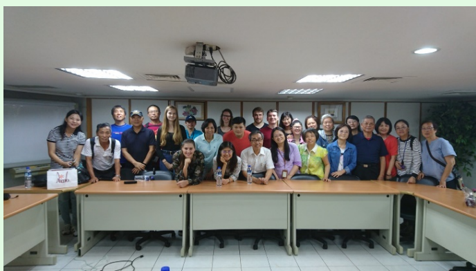
圖 27 生命連線基金會參訪