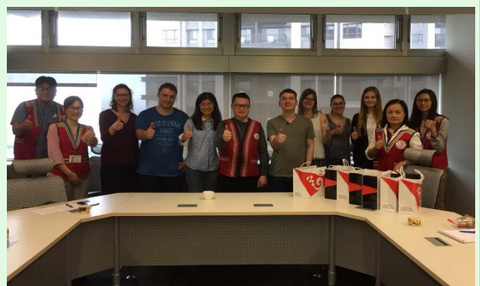
圖 25 原住民委員會參訪