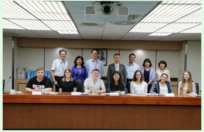
圖 22 勞保局參訪