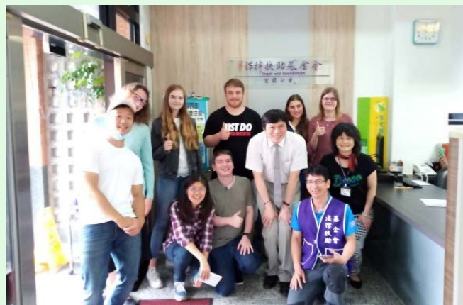
圖 31 法律扶助基金會宜蘭分會參訪