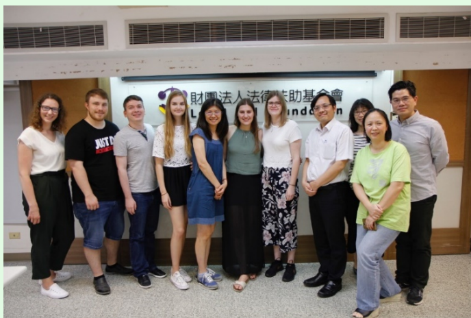
圖 29 法律扶助基金會總會參訪