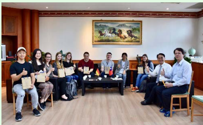
圖 5 拜訪校長