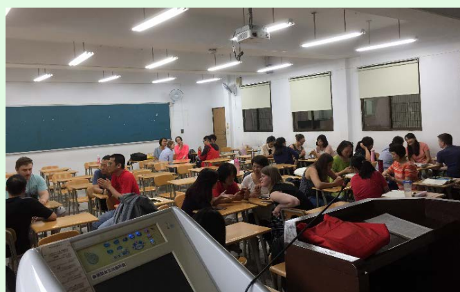
圖 12 於林谷燕老師課程與本校學生互動