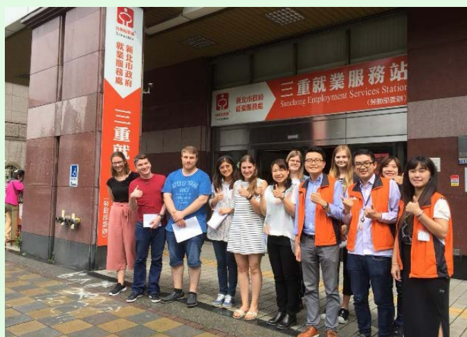
圖 16 新北市政府就業服務處三重就業服務站參訪