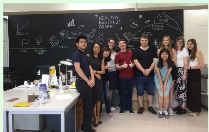
圖 17 臺北市政府產發局委託的臺北創新實驗室參訪

四週實習，主要以認識我國社會安全制度，尤其是我國就業促進制度為主軸，同時比較臺德雙方制度的差異。與往年相同，德國同學首先認識我國立法制度，參訪立法院，繼而就就業促進和失業給付做實務交流而參訪了臺中市政府勞工局（圖 14）和豐原就業服務站（圖 15）、新北就業服務處（圖 16）、臺北市政府產發局和接受產發局委託的臺北創新實驗室（圖 17）；並認識國立海洋大學觀光學程如何輔導學生就業（圖 18），以及中央健保署的任務（圖 19）；為強化就業議題上的經驗分享，今年調整了局部內容，增加德國夥伴後述參訪行程：勞動部（圖 20）、勞動力發展署北基宜花金馬分署和創客基地（圖 21）、勞保局（圖 22），並認識我國的職業重建制度和非營利組織對身障者職業重建的協助（圖 23、24），同時也參訪了原住民委員會（圖 25），了解原民會對原住民所提供的就業促進措施，以及國家對青年就業所未雨綢繆的青年職涯發展中心（圖 26）。而為了瞭解人工智慧在當前醫療照顧上的運用，也認識了生命連線基金會（圖 27）和華康科技開發公司（圖 28）在數位醫療與照顧上的研發和實務運用。此外，為使德國夥伴認識臺灣對於弱勢家庭、某些特殊個案等之法律專業協助，增加了法律扶助基金會的參訪，從總會（圖 29）所提供的法律扶助概念，到參訪新北分會（圖 30）和宜蘭分會（圖 31）的實際運作。