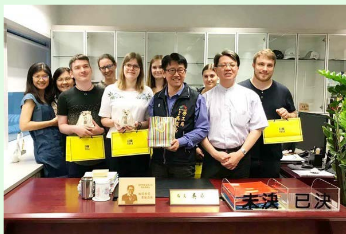
圖 14 臺中市政府勞工局參訪