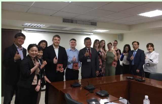
圖 20 勞動部參訪