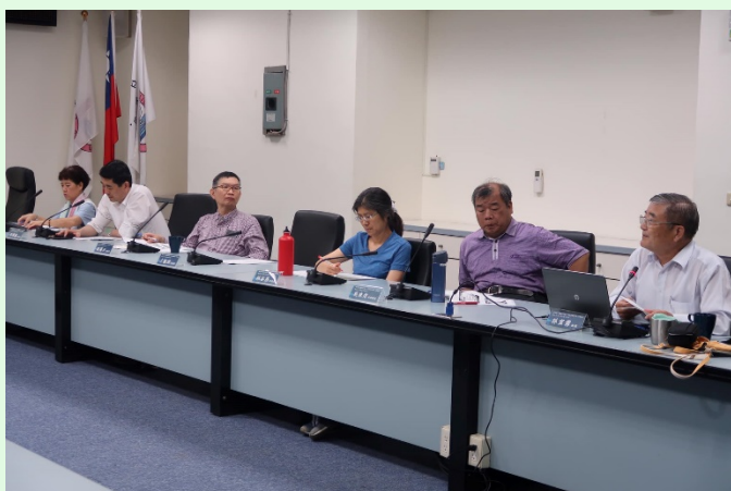
圖 3 本系專任教師及演講貴賓之參與情形