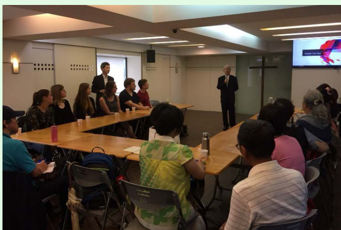
圖 28 華康科技開發公司參訪