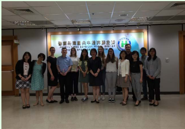
圖 19 中央健保署參訪