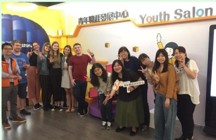
圖 26 青年職涯發展中心參訪