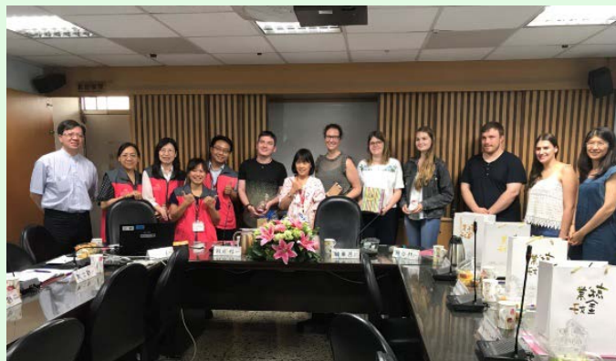
圖 15 豐原就業服務站參訪