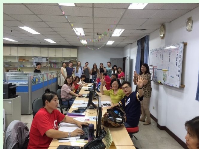
圖 10 拜訪臺中中心