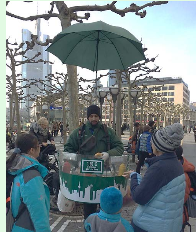
圖 32：德國街頭美食攤商；來源：自攝