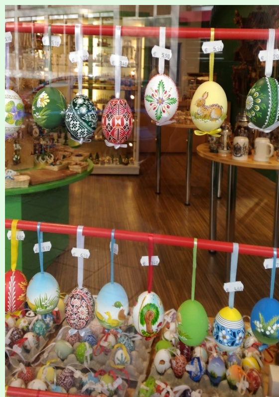
圖 29：德國商家商品陳設