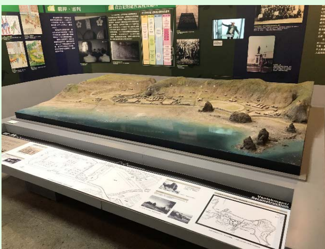
圖 56：景美園區內之綠島園區模型展示