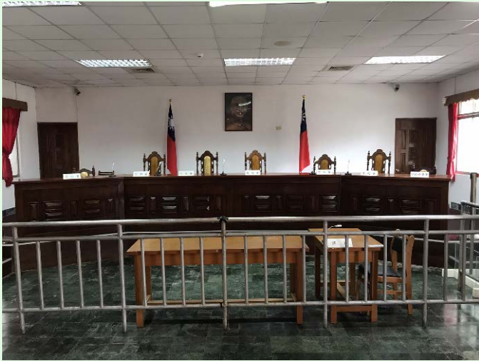
圖 43：景美園區第一法庭內觀