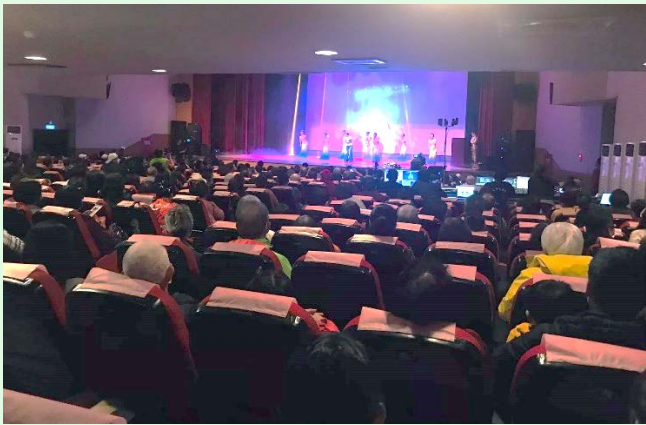
圖 21：節目豐富的慈善公演活動實況