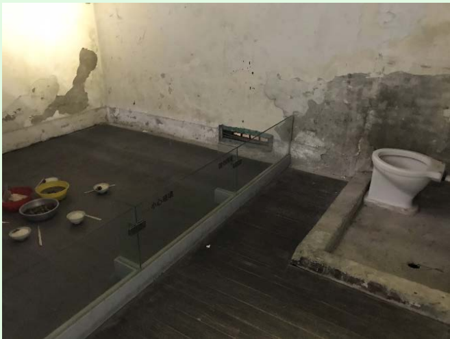
圖 50：景美園區內之監禁處所一景