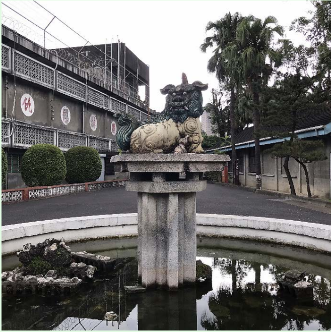
49：景美園區內之「獅豸」