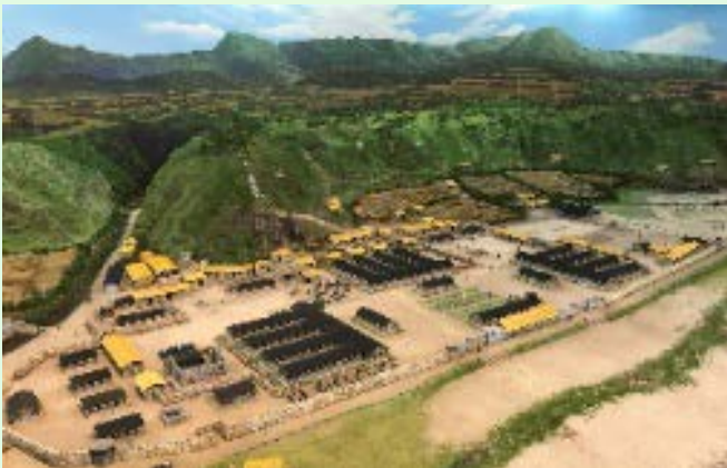
圖 63：綠島園區之全區模型展示