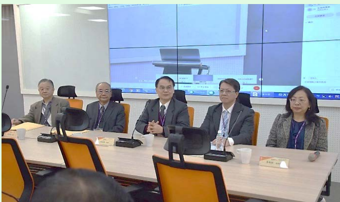
圖 22：本校校長與各主持人致詞