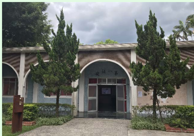
圖 42：景美園區第一法庭外貌