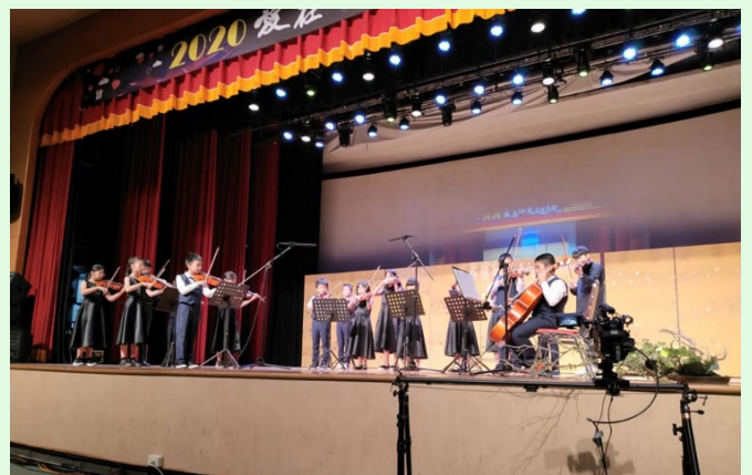
圖 19：節目豐富的慈善公演活動實況