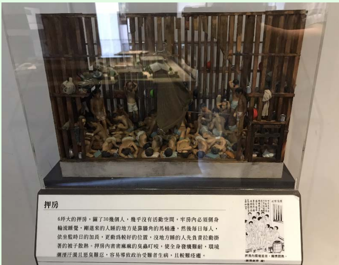
圖 55：景美園區內之昔況模型展示