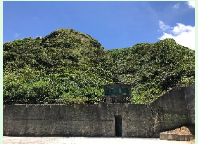
圖 59：綠島園區之監禁高牆；來源：自攝