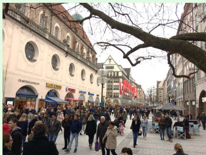
圖 27：德國商店週六人潮；來源：自攝

黃榮堅教授在「靈魂不歸法律管」書中曾提及 (p.75)，商店關門時間法不是干涉營業自由與消費自由，它考慮的是更為深層的事物，也就是要避免不公平的經濟結構。如果允許所有商家都可以在時間上無限制地營業競爭，弱勢者的生存品質將會受到威脅，如果基層人員或勞工連假日都沒有可以好休息的機會，對於家庭生活或未來的人生規劃就根本沒有喘息或可以思考的空間。法律規範從來都不會是完美的，也不會有全盤移植適用的可能，臺灣如果想要仿效德國的作法，可行性不僅太大，引起反彈或衝擊倒是可想而知的。從「商店關門時間法」中所看到的，不應該只是表面上的限制營業自由問題，而是應該觀察到其中所蘊涵更為實質與更為深層的：作為一個人的生活品質問題。