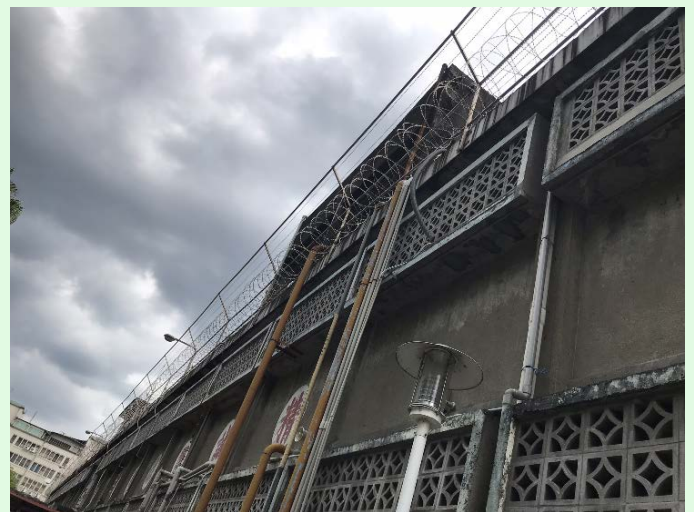
圖 54：景美園區內之監禁處所一景；來源：自攝