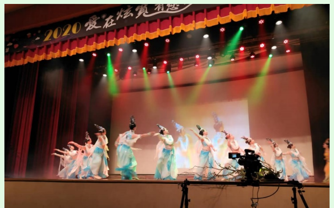
圖 20：節目豐富的慈善公演活動實況