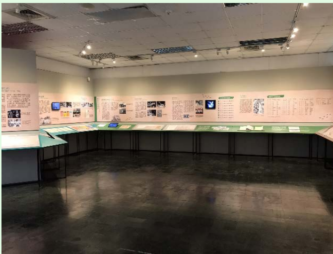
圖 44：景美園區第一法庭展覽