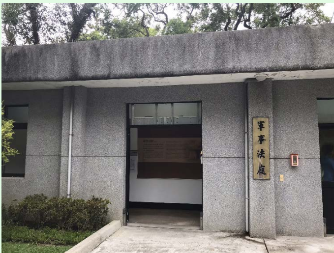
圖 45：景美園區軍事法庭外貌