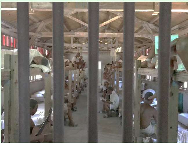
圖 62：綠島園區之模擬監禁情形