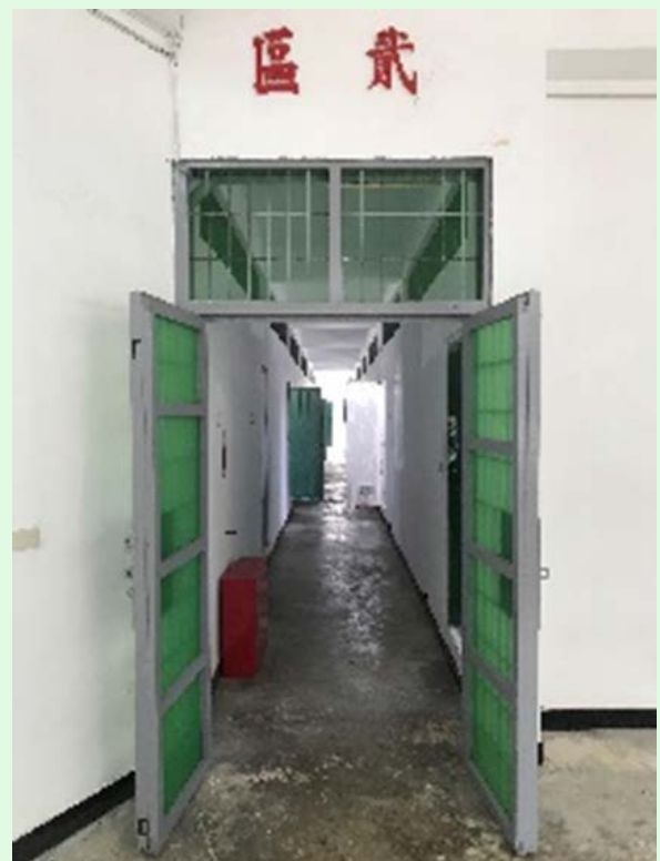
圖 60：綠島園區之監禁囚房；來源：自攝