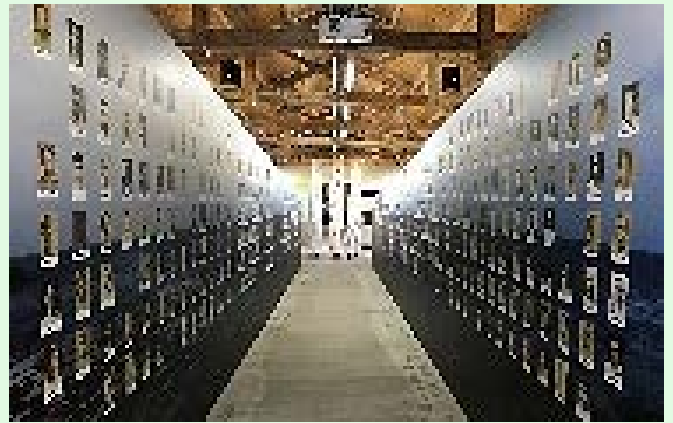
圖 64：綠島園區之受難者紀念牆