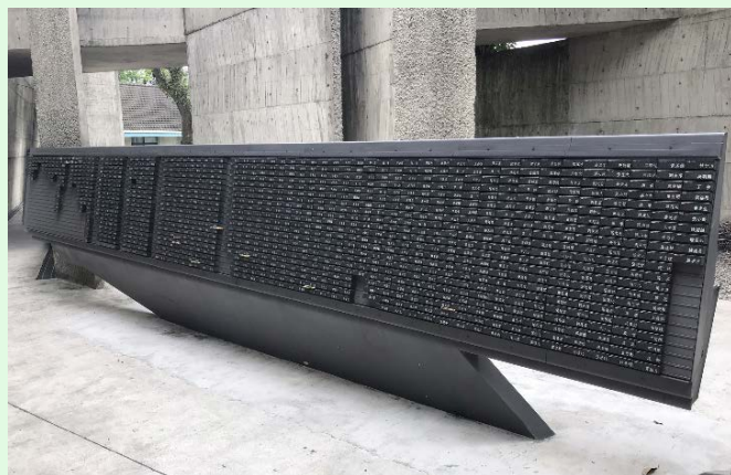
圖 41：景美園區之受難者紀念碑