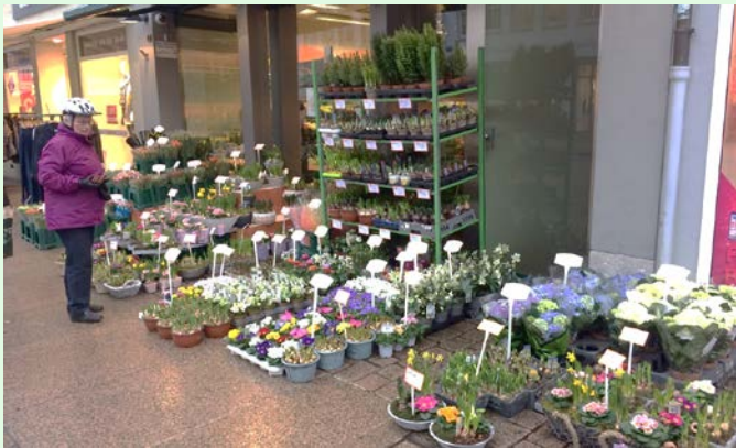
圖 30：德國商家商品陳設；來源：自攝