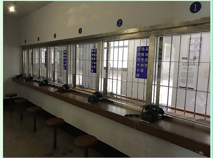
圖 52：景美園區內之監禁處所一景