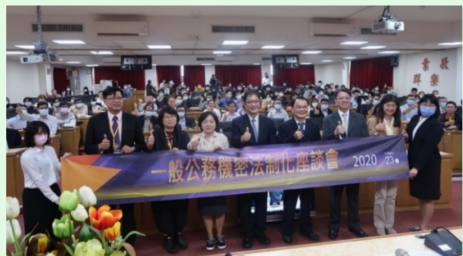
圖 4：來賓與現場聽眾大合照