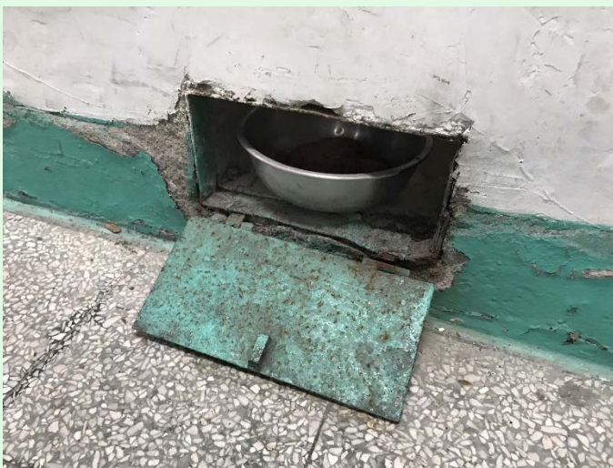
圖 51：景美園區內之監禁處所一景；來源：自攝