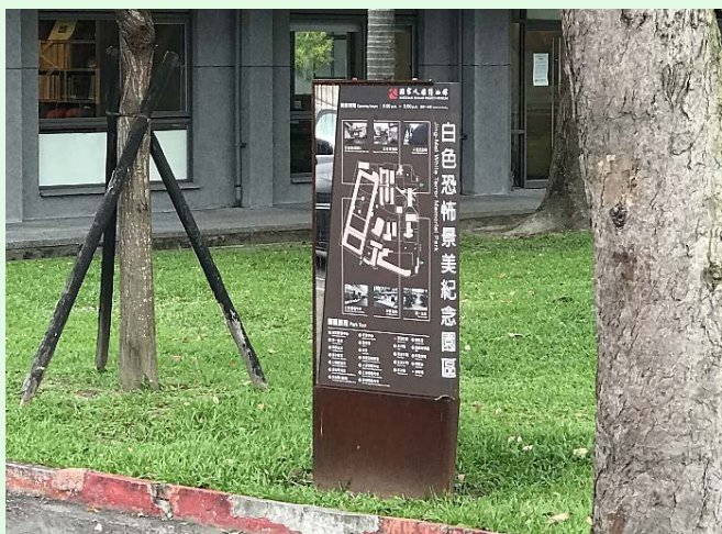
圖 38：景美園區入口標示