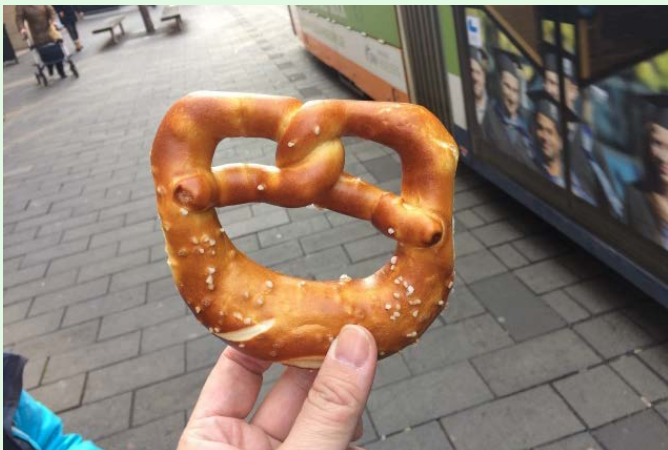
圖 31：德國常見國民美食；來源：自攝