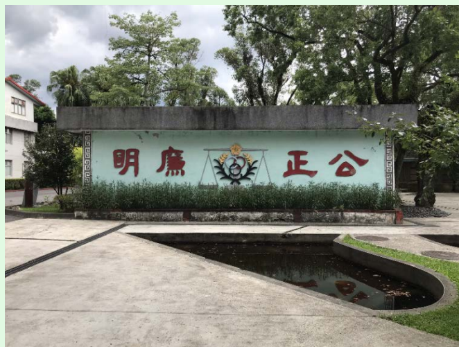
圖 40：景美園區內之一景；來源：自攝