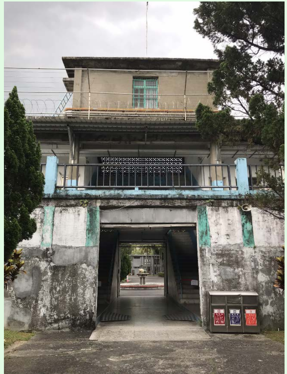
圖 53：景美園區內之監禁處所一景