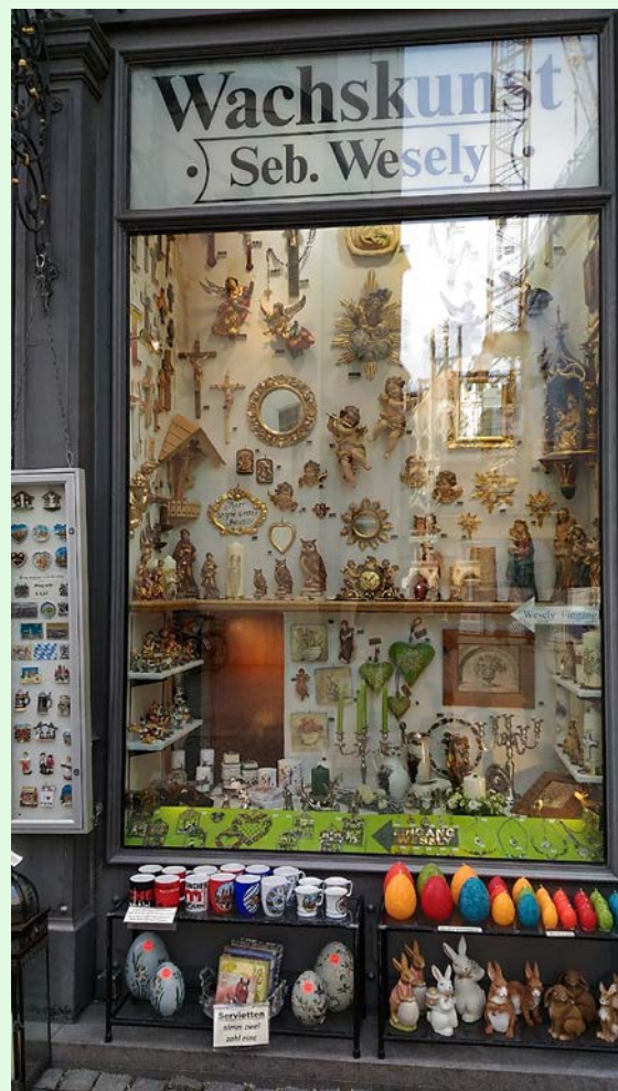
圖 28：德國商家商品陳設