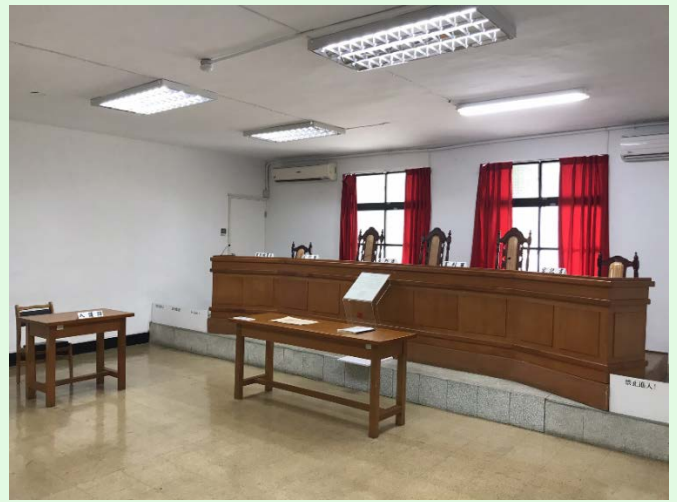
圖 46：景美園區軍事法庭內觀；來源：自攝