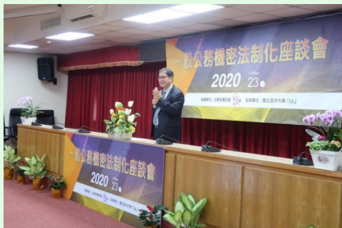
圖 2：廉政署鄭銘謙署長開幕致詞

本次報名參加的現場與會者多為現職之公務人員，多達一百三十多位參加，可見得此一議題對於實務工作者的重要性。如果再加上報名參加線上參與的人數，本次座談會之活動超過一百六十多位，應是本系近年來所辦理的活動當中人數最多的一次。會後，許多參與者對此議題仍然踴躍相關意見或建議，並對於活動之規劃、討論、交流、互動、服務...等，給予相當高的評價，對於空大的環境也留下十分深刻的印象。