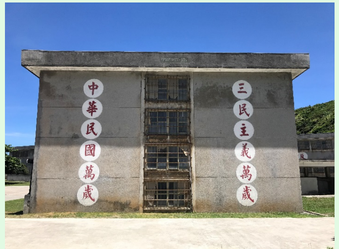
圖 58：綠島園區之昔日建物