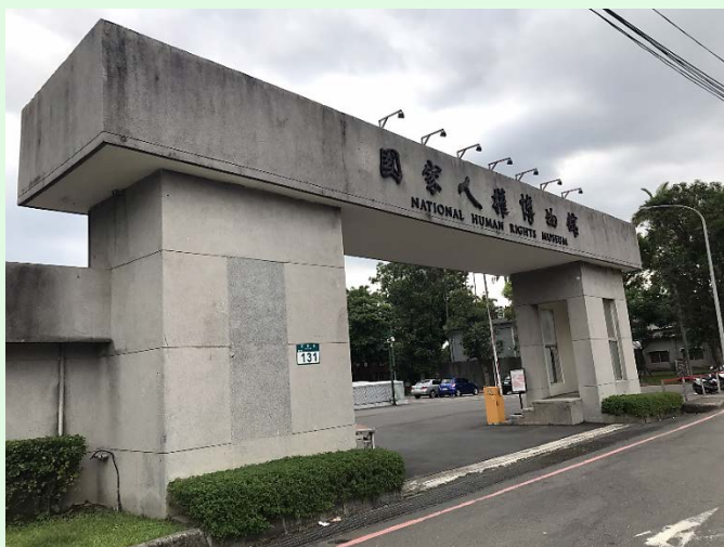
圖 37：景美園區大門景象

開會決議，園區現狀應妥為保存，作為見證威權統治時期，國家暴力侵害人權的重要歷史遺址。2018年3月15日人權館正式成立，5月18日於「白色恐怖景美紀念園區」掛牌。