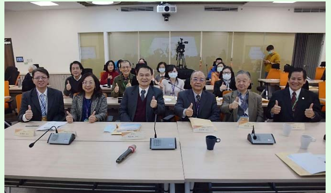
圖 24：研討會大合照留影