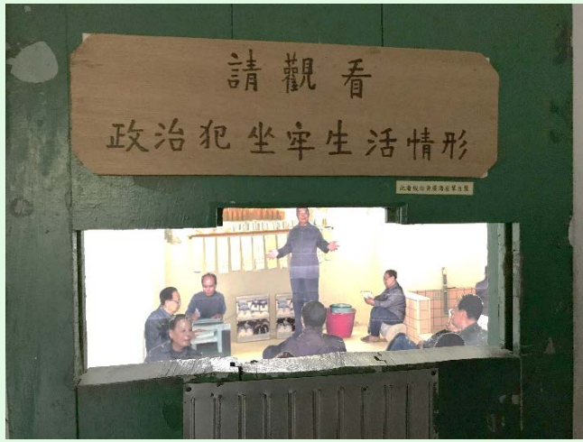
圖 61：綠島園區之模擬監禁情形