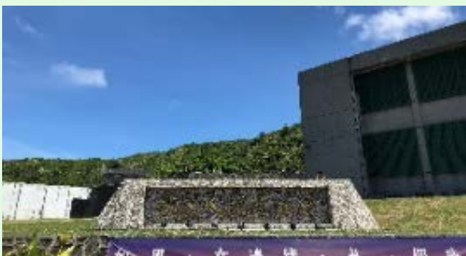
圖 57：綠島園區入口外貌；來源：自攝

依官方網頁上之相關說明介紹 ( https://www.nhrm.gov.tw/content_155.html )，「白色恐怖綠島紀念園區」位於綠島東北角，占地面積為 32 公頃，前身為臺灣省保安司令部(後為臺灣警備總司令部)新生訓導處(1951 年~1970 年)、其後另設國防部綠島感訓監獄(1972 年~1987 年)，為「白色恐怖」時期政治受難者發監執行的監獄。