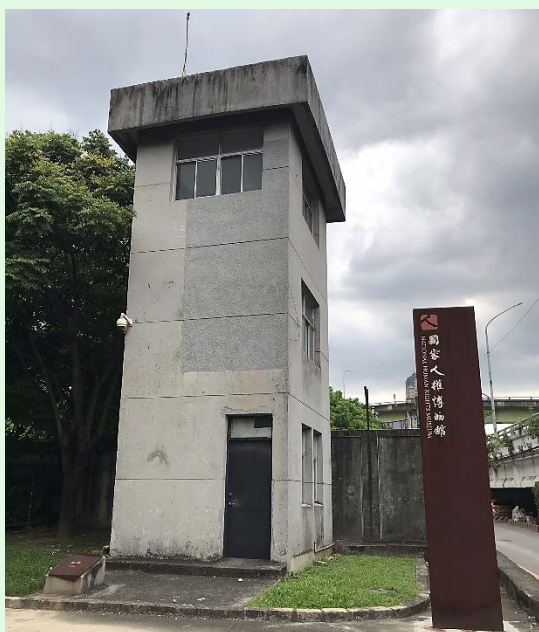
圖 39：景美園區側門立牌