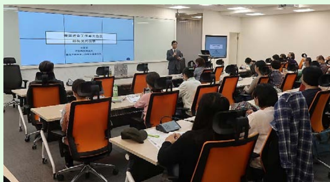
圖 9：林萬億教授演講「社會工作的現在與未來」實況