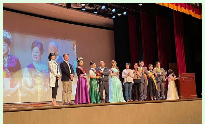
圖 18：受贈捐款的炫寬愛心教養家園回贈感謝紀念品