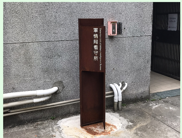
圖 48：景美園區之軍情局看守所