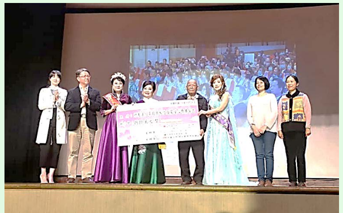
圖 17：本次活動單位將募款所得捐予炫寬愛心教養家園