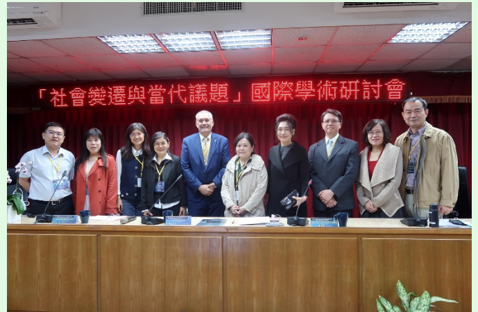
圖 1 本次研討會大合照

乎主辦單位事先的估計，在會議前幾天還臨時更改會議地點到本校的國際會議廳，總計本次自發主動報名參與的人次有百人之多，是歷年來本系辦理相關活動參與人數最多的一次，不僅提升本校本系聲譽，也因為積極推動國際交流活動，進一步促使國外的學術界更加瞭解臺灣、瞭解空大。