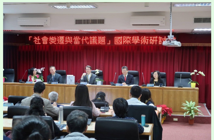
圖 2 本次研討會來賓致詞