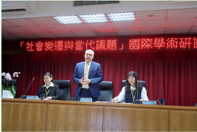
圖 5 奧地利薩爾斯堡大學 Pfeil 教授專題演講