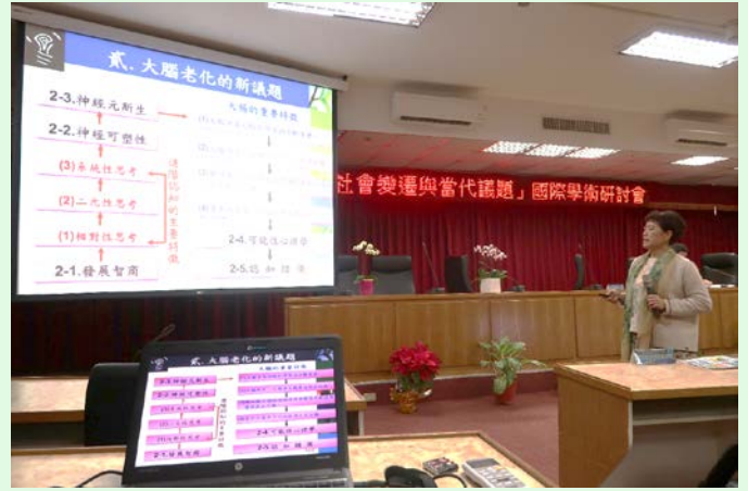
圖 8 研討會論文發表實況 (二)