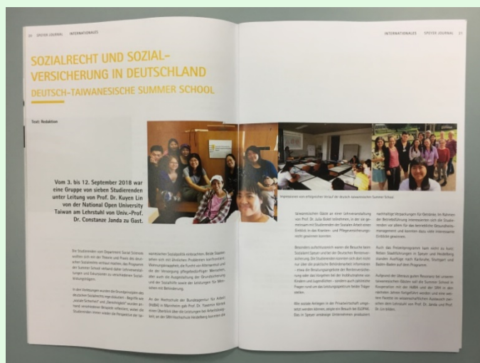
圖 12 徐拜爾大學報導本系同學參加 Summer School