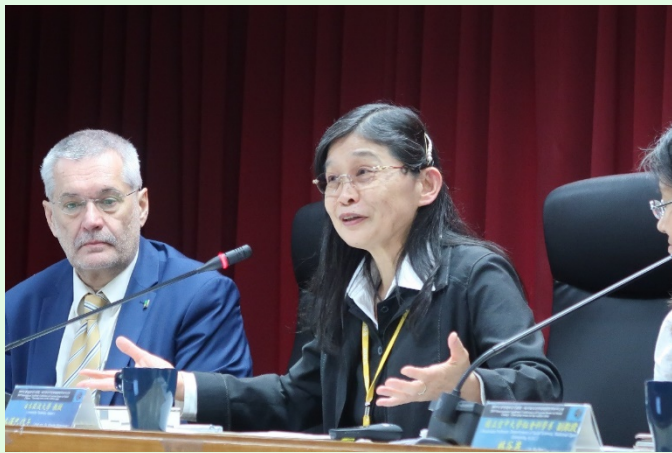
圖 6 日本筑波大學本澤教授專題演講