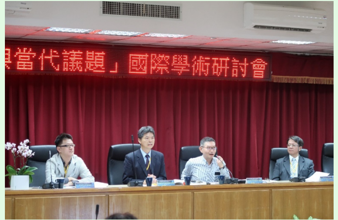
圖 9 研討會論文發表實況 (三)