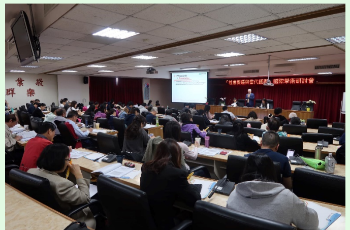
圖 10 本次研討會參與者十分踴躍