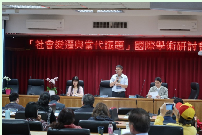
圖 7 研討會論文發表實況 (一)